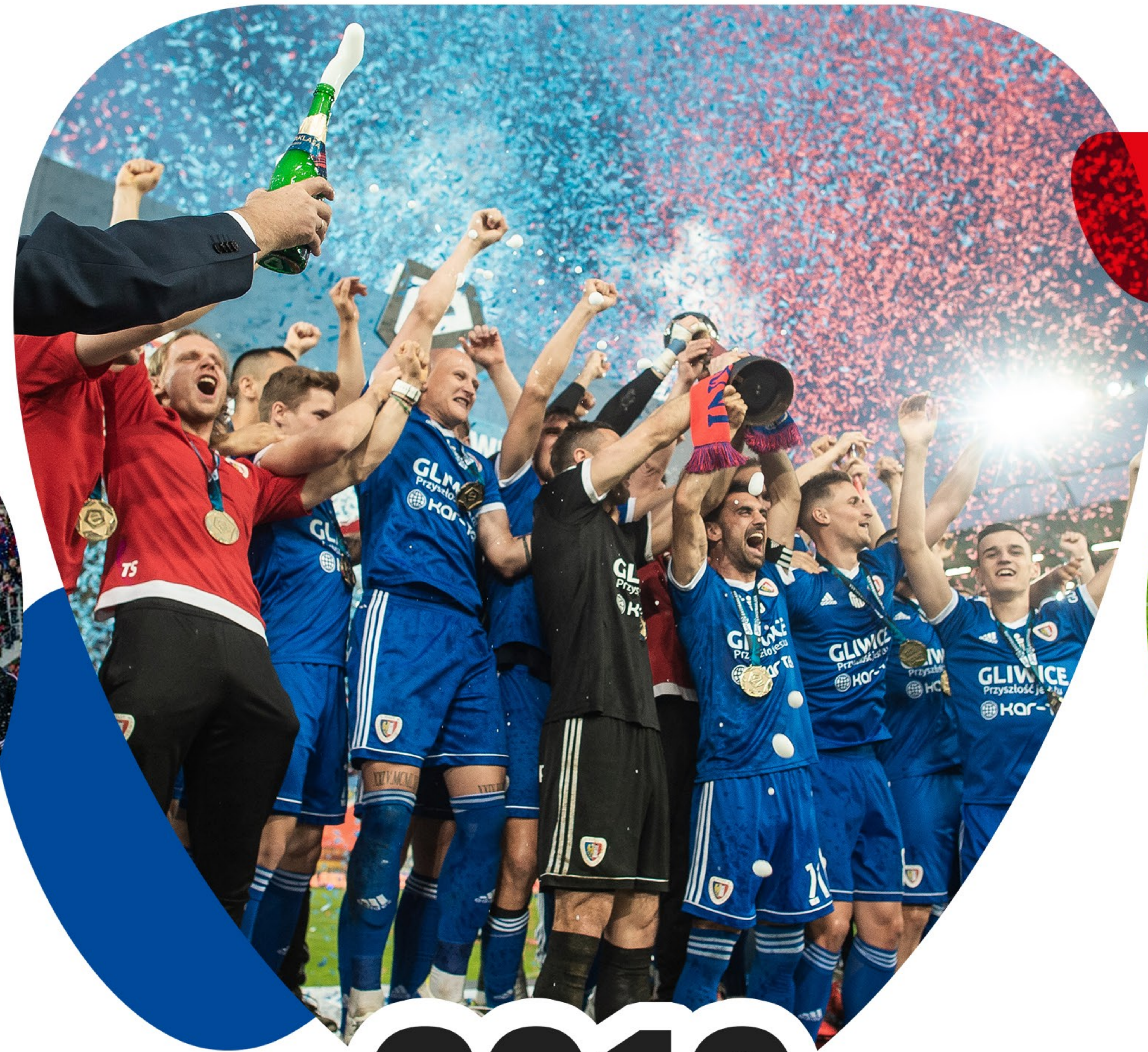
2019 Mistrzostwo Polski