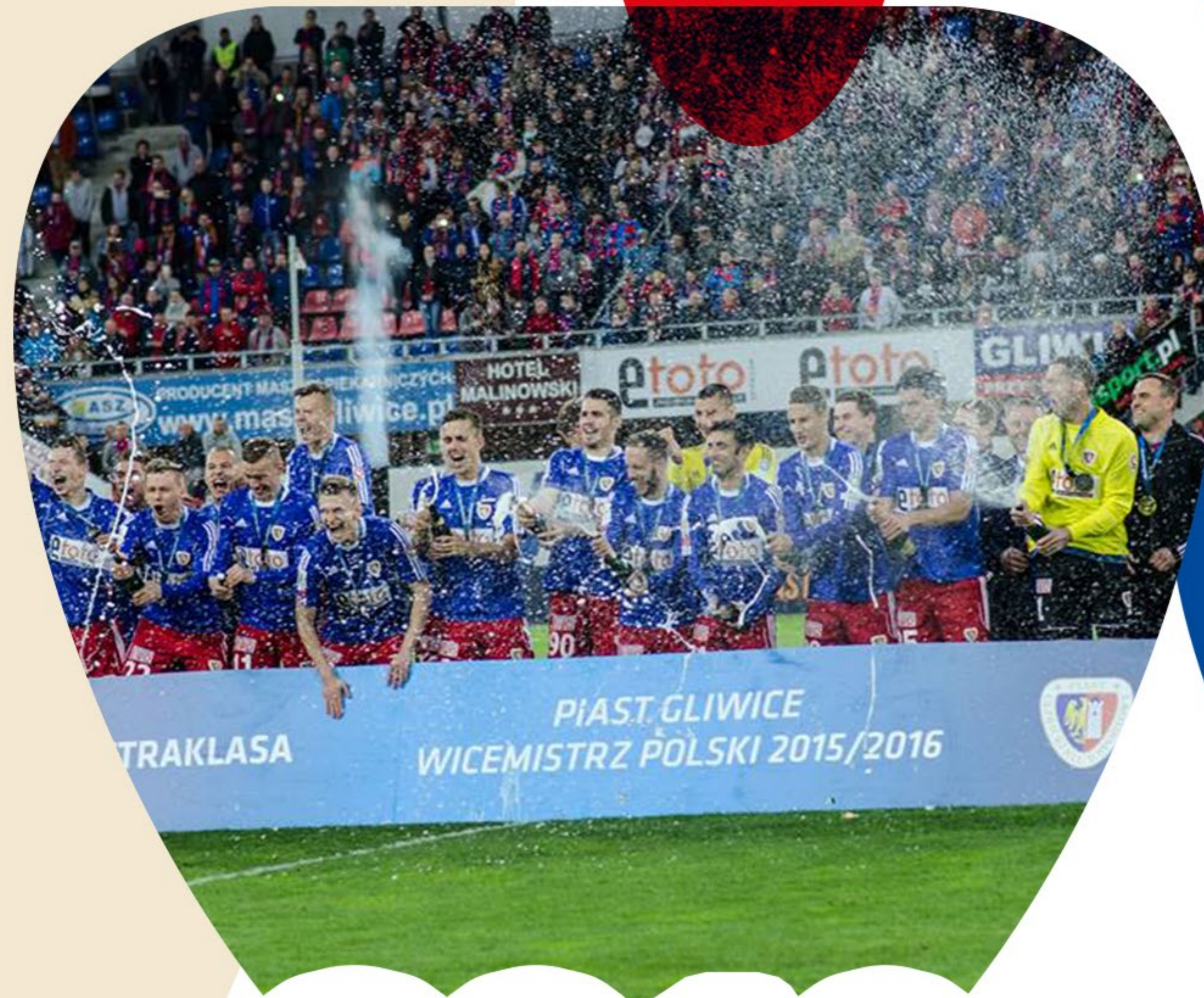
2016 Wicemistrzostwo Polski