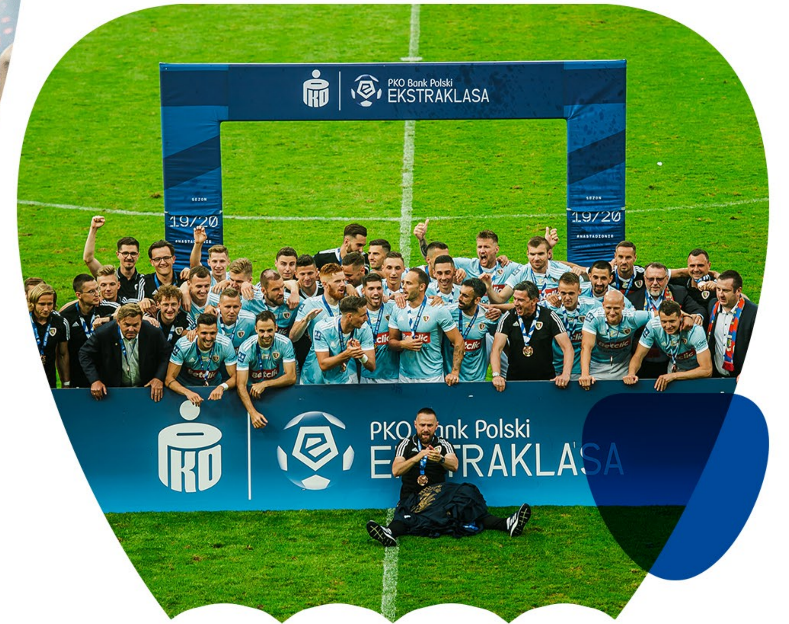
2020 Trzecie Miejsce